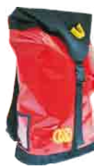
ROPE BAG 100