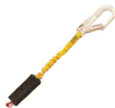
EAW I SET