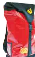
ROPE BAG 100 M