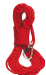
STATIC LANYARD 25 M CARBON HARNESS EYE