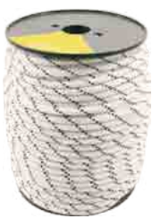
STATIC ROPE 10.5 (optional)