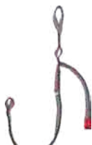
Y RESCUE LF