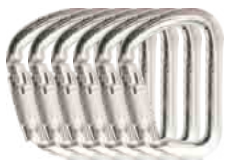
X-LARGE C. STEELAB