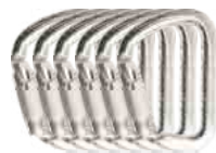
X LARGE C. STEEL AB