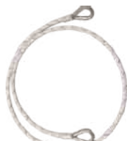
WIRE STEEL ROPE 100 CM