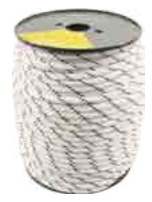
*STATIC ROPE 10.5