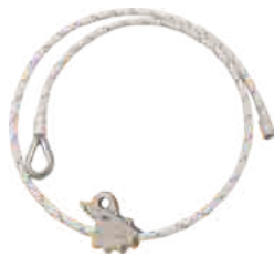
ADJUSTABLE STEEL LANYARD