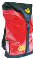
ROPE BAG 100