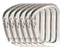
X LARGE C. STEEL AB