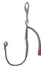
Y RESCUE LF